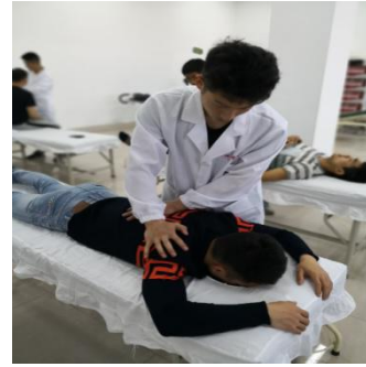
推拿按摩实操课堂