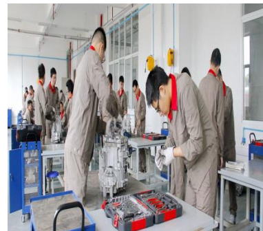
汽车发动机维修检测实训室