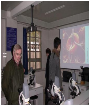
德国专家参观实验中心

中心有教授、研究员 11 人，副教授 16 人，博士 7 人，硕士 16 人，建成省级教学团队 1 个，获省政府教学成果奖 7 项、州市及以上科技成果奖 7 项。