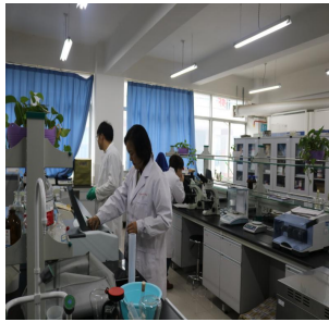
动物医学实验示范中心

中心有教授 4 人，副教授 13 人，博士 6 人，硕士 13 人，建成省级教学团队 1 个，获省政府教学成果奖 7 项、州市及以上科技成果奖 7 项。