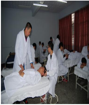
体育保健学实训室

中心目前拥有教授 1 名，副教授 2 名，讲师 2 名，其中在读博士 2 名，硕士 3 名，师资力量学历职称结构合理。