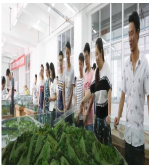
城乡规划设计制作实训室