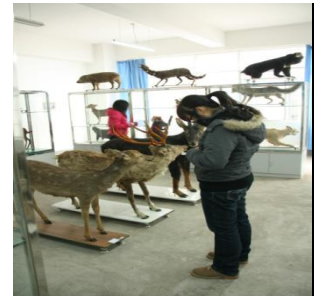
动物标本实验室中心

中心现有实践教学类专任教师 25 人，教授 5 人、副教授 13 人、博士 1 人、硕士 12 人。