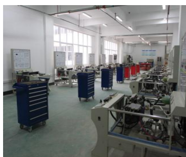
汽车电器综合实验室